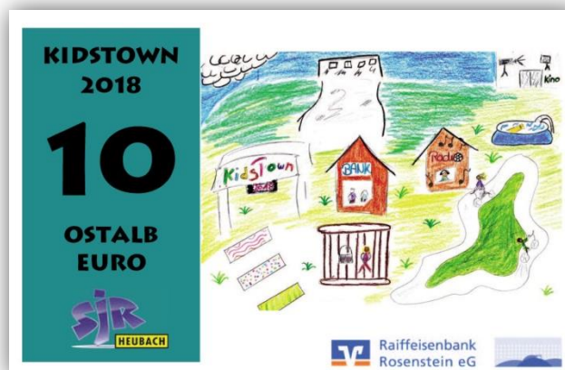
Geldschein mit einem der Gewinnerbilder von Kidstown 2018

Sehr wichtig: Es können nur Bilder berücksichtigt werden, die in Querformat gestaltet werden. Eine unabhängige Jury sucht die sechs schönsten Bilder aus und teilt die Gewinnerbilder den Geldwerten zu.